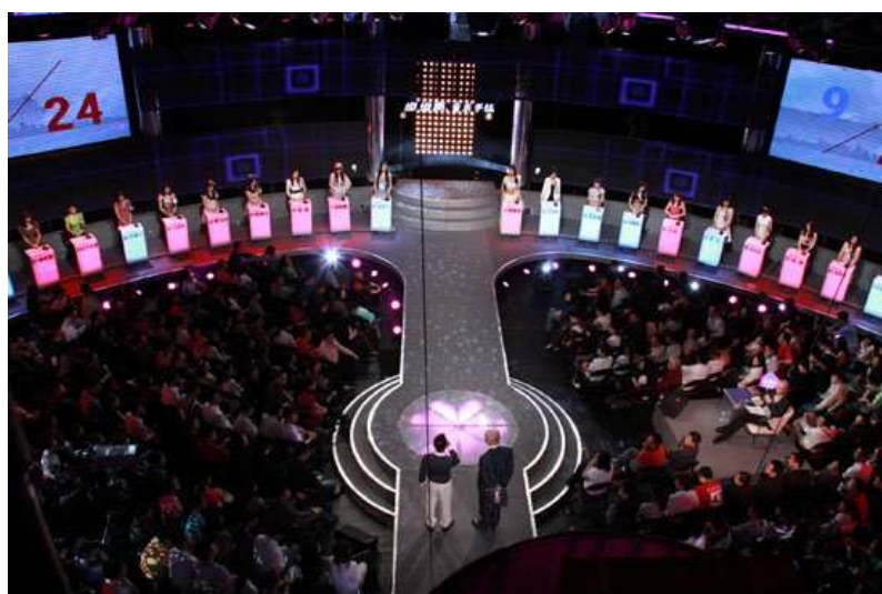
《非诚勿扰》的半圆形狂欢广场和多对一的围观广场（上图）

对于当下真人秀节目来说，目前以《非诚勿扰》和《职来职往》为代表的节目形态便重建出了一个可知可感的狂欢广场，这也就是我们组突发奇想提出来的“斗兽场”。从视觉上说，这一形式主要表现在多对一的半圆环舞台、亮灯灭灯的晋级程序和对草根嘉宾焦点化呈现上；从听觉上说，这一形式主要体现在不同嘉宾之间多角度多立场的话语交锋上，丰富的视听体验共同营造出一个假定性极强的“斗兽场”。