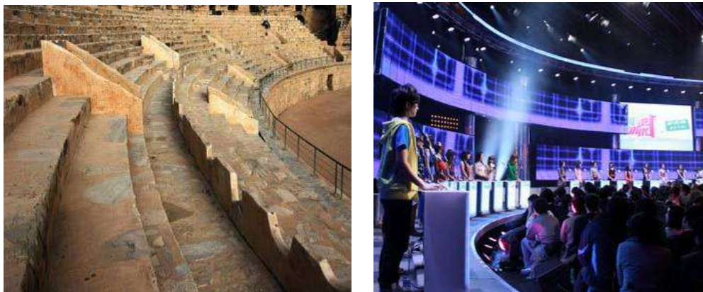
古罗马斗兽场的座位设置与《非诚勿扰》的女嘉宾站位设置（上图）