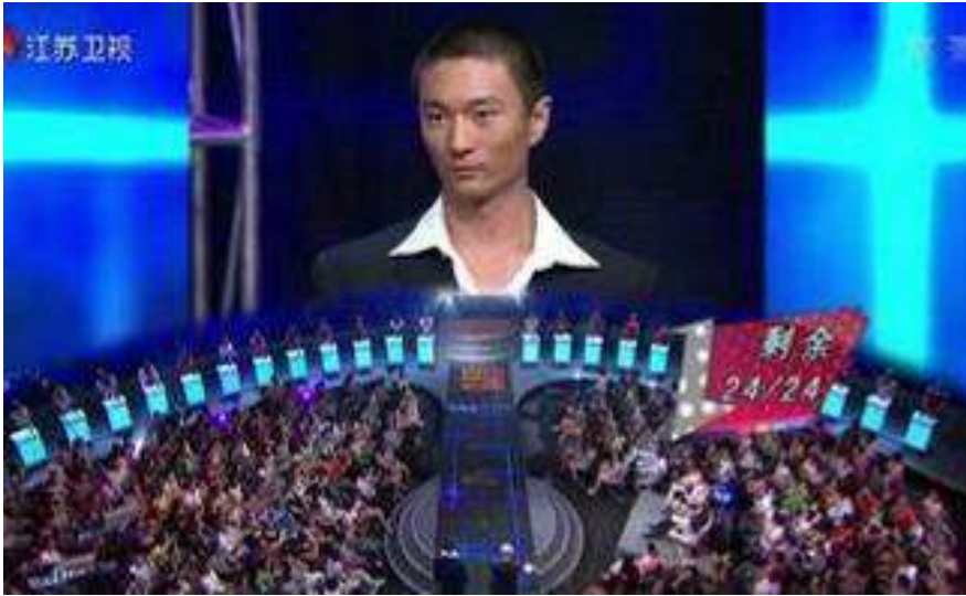
《非诚勿扰》中暴露嘉宾隐私信息的大屏幕与《楚门的世界》极为相似（上图）