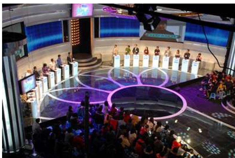
《职来职往》的半圆形狂欢广场和多对一的围观广场（上图）