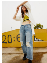
牛仔是永远年轻的符号

服装本身以他的造型,如尺寸、廓形,款型,色彩,质地和纹理等,传达各种信息、语言和符号。