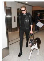
一酷到底底是街头青年的符号

会流传的木版画,它广泛出现在民间百姓的日常生活里。与之对应的,木版年画的题材也是丰富多彩、包罗万象,且多与人民群众的精神寄托和日常生活息息相关,多表现于对上天的崇拜及对美好生活的追求。木版年画蕴含着劳动人民的思想和智慧,体现着民族审美的传统风韵。木版年画是民间化、社会化的艺术形式,不受到群体及阶级限制,所以深受广大人民的青睐。当年著名的木版年画中心有河北武强、江南姑苏桃花坞、天津杨柳青、山东杨家埠等等。