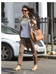
休闲装是小资白领的符号

个人形象与服装：我们现在是一个注重“个人形象”的时代，“服装的外观在各种情境架构中具备一定的社会意义”外观是我们日常生活中看别人时的整体印象，不仅仅只关注于服装，还包括穿着者的个人形象设计中，包括发型，妆面，服饰以及礼仪四个部分，服饰搭配是个人形象中最重要的部分。