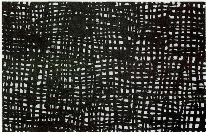
图5 李华生《9902》(局部)(145cm×145cm, 宣纸水墨, 1999年)

意象符号基于柔性有机的物质基底自我再现, 指示、像似、规约所指涉的云烟、山川、大地, 抑或创造性地再现和征召的道、观念等诸多层面关联起来建构意境空间。意义在这些层面回环往复, 不断地延伸根系, 汲取所需的有机质, 有着与时间、历史、存在、理念等意义维度联结的可能。“因