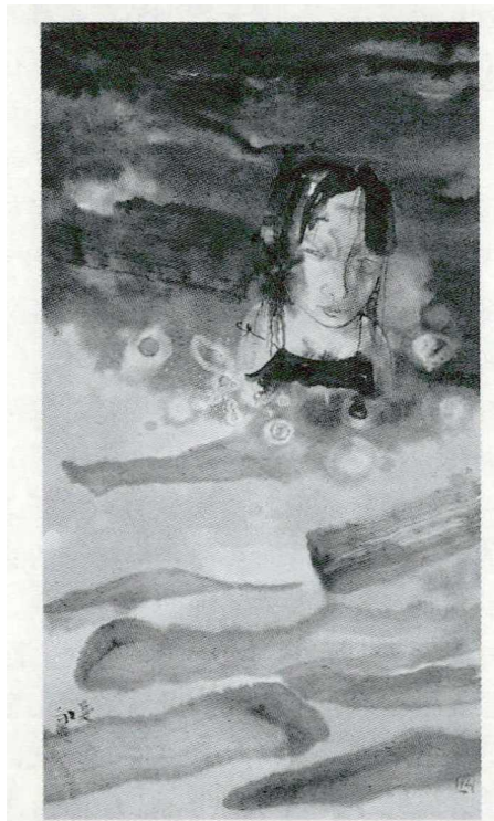
图1 刘庆和《C夜游——浮》(136cm×68cm, 纸本水墨, 2003年)

他的生活存在。刘庆和“早在美院时期就对‘意象表现’产生了特殊情感”(2014),他的人、物象、自然、都市等都是意象性的存在,这些意象符号指向现实物象形体,但更为重要的是再现和征召某种超越性意义,这种超越性是意境,是存在,抑或是片段化的记忆或感知。刘庆和的《夜游》系列出现水、女性、夜色等意象(图1),近处水纹波动,远处水幽深不可测,女人表情虚无,夜色深沉,这一切在水墨与宣纸的晕染皴擦中变得斑驳起来。在模糊的黑夜,我们陷入了无穷的“黑”,人对“夜游”的本能的“畏”及一系列复杂情感逐渐被征召出来,但“畏”又不等同于害怕,因为“畏”之所畏者,是在世本身这种人存在于世的情绪体验。