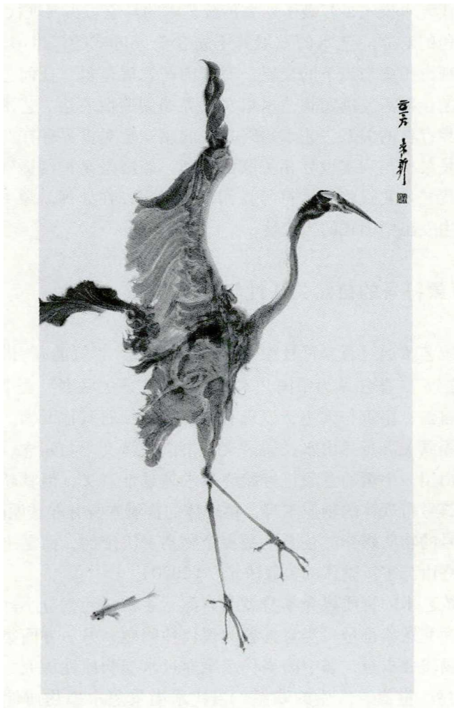
图2 周京新《鹭鱼》系列（局部）（152cm×83cm，宣纸水墨，2016年）

周京新以同样的方式处理“眼”与“心”的关系（图2）。他极其注重笔墨之“工”和技术问题，要将他眼前的自然全部画下来，要以笔墨表达自然所具有的深度与空间。周京新始终关心自然物象如何呈现的问题，以笔墨解答事物被我们看见的“可见性之谜”。他真正关心的是意象符号的再现问题，不回避具象与写实，认真探究如何通过水墨、雕塑与造型再现眼前的自然。与此同时，在处理具象与造型的过程中，他让我们看到某种中国式当代意味的生发。