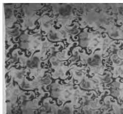
(c) 对鸟菱纹绢地“乘云绣” (d) 罗地“信期绣”丝绵袍