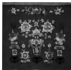
(a)“富贵平安”刺绣桌围图 (b)民国“瑶姬献瑞”湘绣纸画